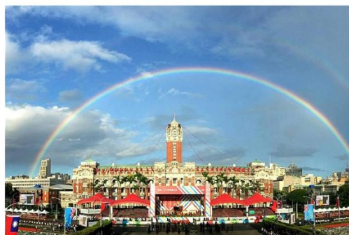
雙十國慶。慶祝活動